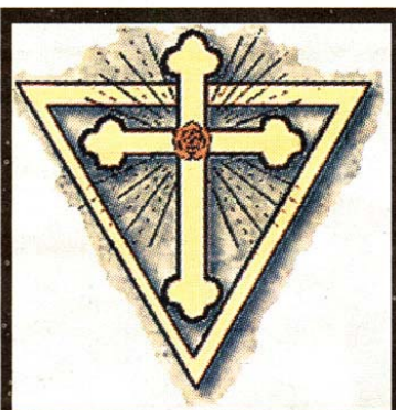
Trokut i križ i s ružom simboli su ezoterijskog traganja za istinom

- AMORC je sada registriran kao strana udruga u sklopu Velike lože njemačkoga govornog područja. Počeli smo s radom, članovima se redovito šalju monografije i održavaju se skupovi. Priprema se i rad AMORC - Kulturnog foruma, za pro-