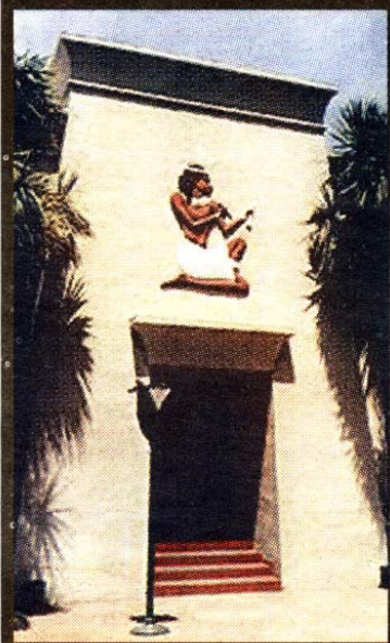
Rozenkrojceri, kako ih nazivaju, proučavaju i tajne drevnog Egipta skrivene i u omjerima piramida